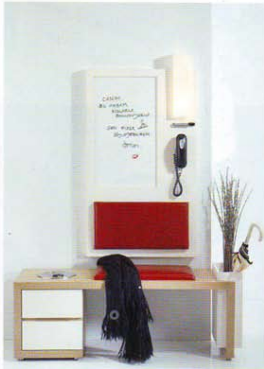
Ürün: giriş ünitesi Model: Fetiş telefonluk İşveren: Selme Mobilya ve Dek. Ltd. Şti. Ürünün üreticisi: Selme Mobilya ve Dek. Ltd. Şti. Proje yılı, üretim yılı: 2004 Ürünün pazarlandığı ülkeler: Türkiye Ürünün malzemesi ve üretim tarzı: 30 mm.ham mdf üzeri parlak lake Tasarım: Murat Babadağ