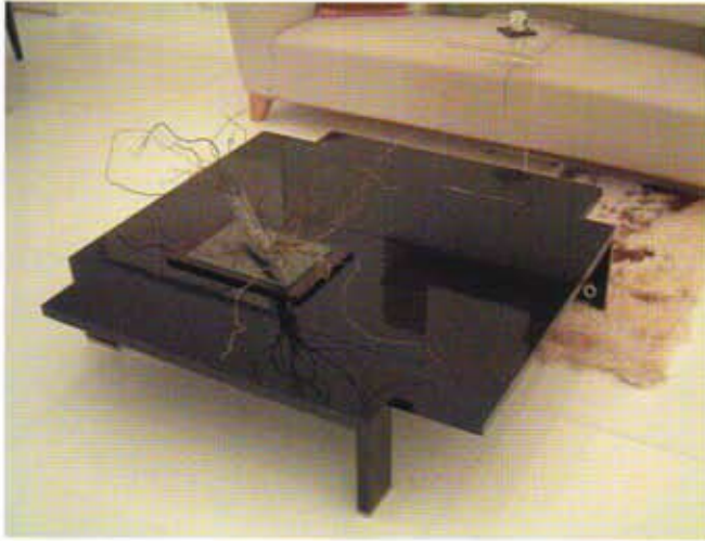
Ürün: Orta sehpa Model: Broken sehpa İşveren: Selme Mobilya ve Dek. Ltd. Şti. Ürünün üreticisi: Selme Mobilya ve Dek. Ltd. Şti. Proje yılı, üretim yılı: 2005 Ürünün pazarlandığı ülkeler: Türkiye Ürünün malzemesi ve üretim tarzı: 30 mm.ham mdf üzeri parlak lake Tasarım: Murat Babadağ