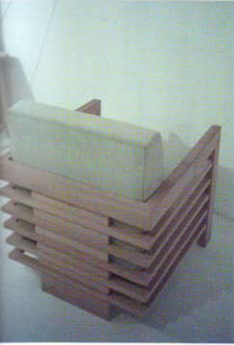
Ürün: Oturma elemanı Model: Wright koltuk İşveren: Cihangir mobilyacı mobilya ve dekorasyon Ürünün üreticisi: Cihangir mobilyacı mobilya ve dekorasyon Proje yılı, üretim yılı: 2006 Ürünün pazarlandığı ülkeler: Türkiye Ürünün malzemesi ve üretim tarzı: Ahşap karkas üzeri sabit font Tasarımın monte edildiği oturma elemanı Tasarım: Murat Babadağ