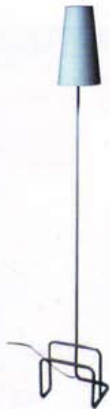
Ürün: Aydınlatma armatürü (Budun design yarışması ikinciliği) Model: Minorty lamba İşveren: Budun design Ürünün üreticisi: Budun Design Proje yılı, üretim yılı: 2004 Ürünün pazarlandığı ülkeler: Türkiye, Japonya Ürünün malzemesi: 13 mm. galvaniz boru ve elektrik kabloları Ürünün atölye ölçekli üretim ve seri üretim Tasarım: Murat Babadağ